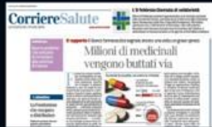
CORRIERE DELLA SERA